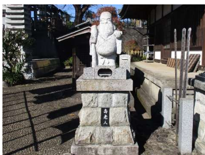
白井七福神・寿老人