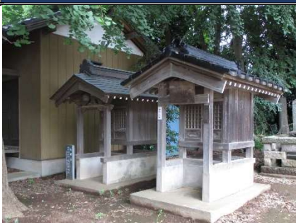
観音堂(左)、番外(中)、第13番(右)