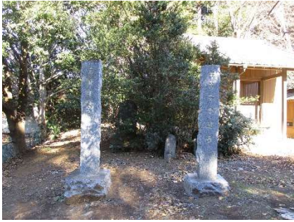
迎寺壺良毛別院の山門