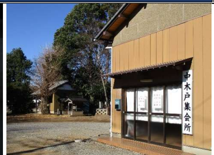
観音堂(左)、中木戸集会所(右)