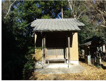
観音堂（来迎寺別院）