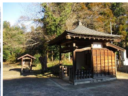
大師堂 (左) と地藏堂 (右)