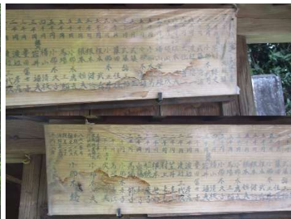
大師堂奉賛者名 (平成18年)