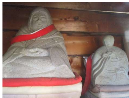
御大師様(右)(左は伝教大師?)